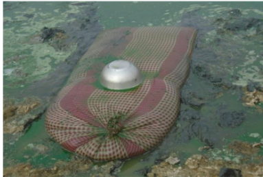
Photo 3. Exfiltration de la spiruline