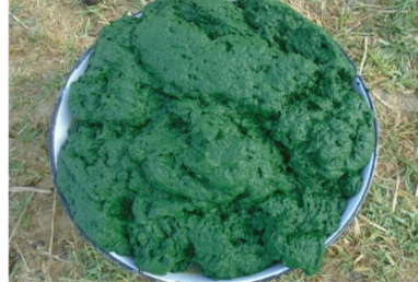
Photo 4. Spiruline fraîche après exfiltration