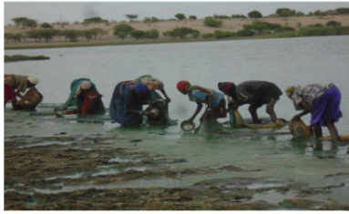
Photos 1. Récolte de spiruline dans le wadi d'Artomossi