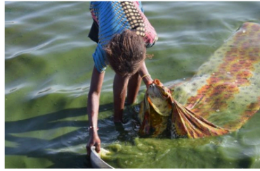
Photo 2. Récolte de la spiruline, filtrage et pressage