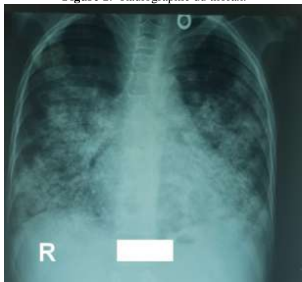
Figure 1:- Radiographie du thorax.

Après admission en réanimation et mise en condition comportant une oxygénothérapie par masque à haute concentration à 15l/min et remplissage vasculaire, le patient a bénéficié d'une radiographie du thorax (figure 1) et d'un scanner thoracique (figure 2) objectivant des foyers de condensation bilatéraux renfermant des bronchogrammes aériens sans épanchement pleuropéricardique ni d'adénopathies médiastinales évoquant a priori une pneumopathie bactérienne. Vu le contexte de la pandémie covid 19, le patient a bénéficié d'un complément PCR SARS-COV2 revenue positive.