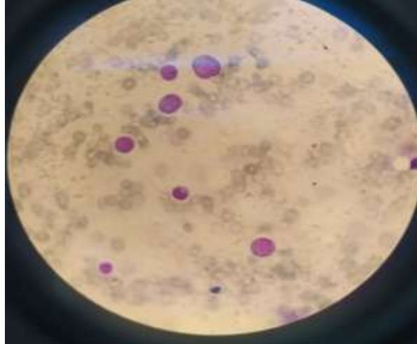
Figure 4:- Immunophénotypage.