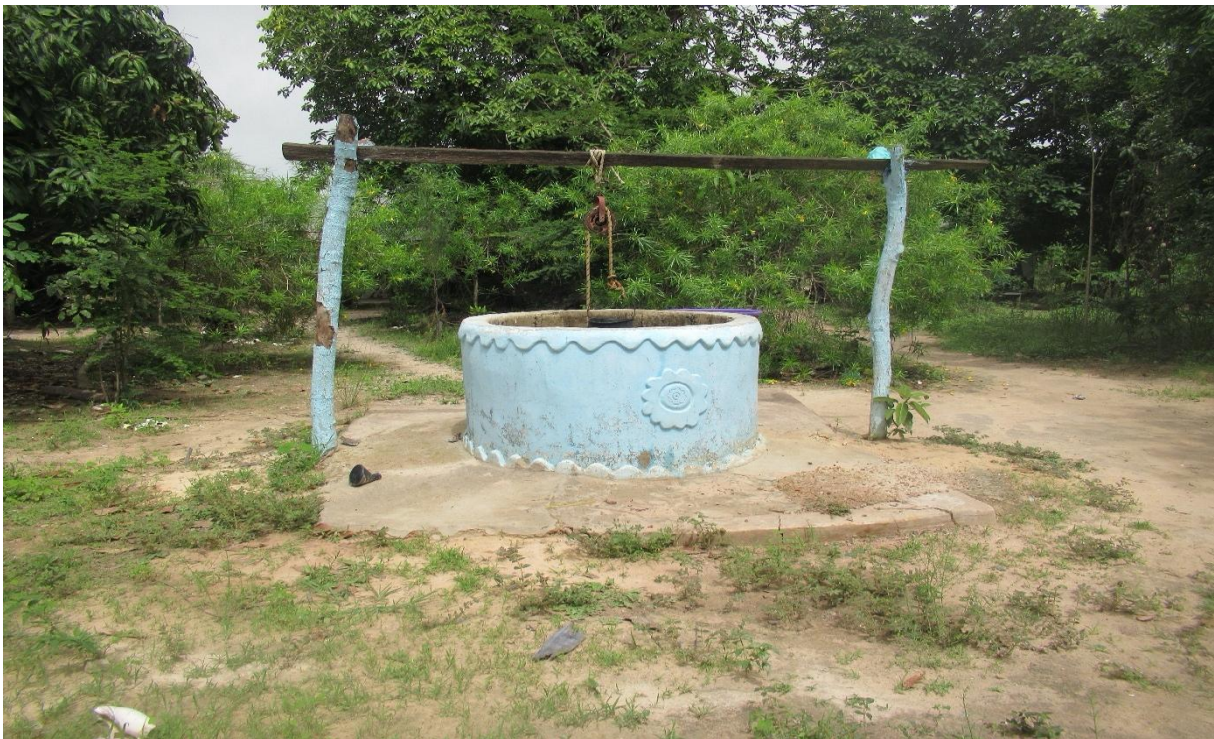
Photo 2: Le puits principal. Historiquement, premier puits construit à Ladioba (1999).