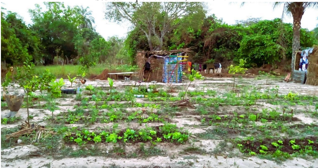
Photo 3: L'un des nouveaux jardins.

La question de l'absence d'argent générée par la permaculture revient souvent dans les discours des candidats au