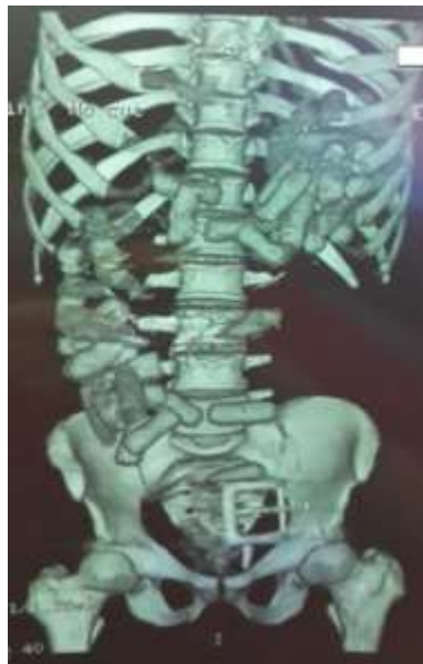
Figure 4: La reconstruction 3D permet de visualiser la localisation exacte et le nombre de capsules dans le tube digestif, réparties principalement dans l'estomac, le côlon ascendant, le côlon transverse et le rectum.