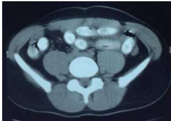
Figure 2:- Coupe axiale d'une TDM abdominale montrant des structures oblongues à forte densité, indiquant une présence anormale d'objets dans le tractus intestinal, cohérente avec des emballages de drogue.

La distribution des capsules dans l'intestin suggère qu'elles ont été ingérées et qu'elles progressent le long du tube digestif.