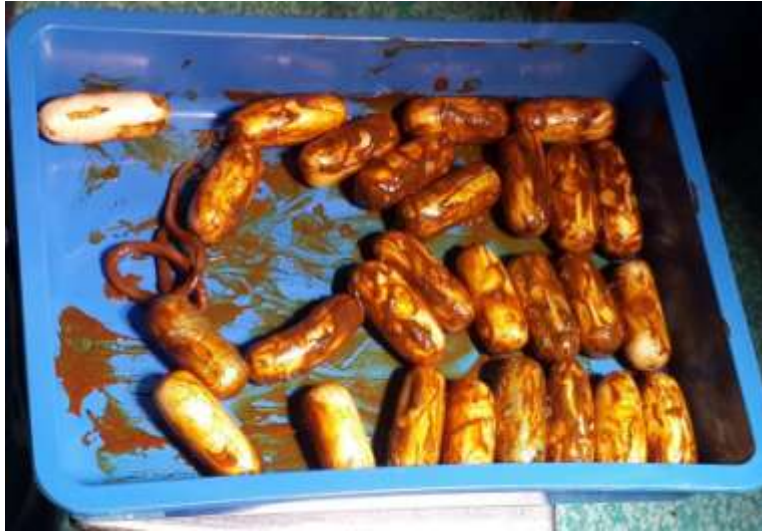
Figure 5:- Photographie des capsules de cocaïne expulsées par voie basse.

L'ECG montrait une tachycardie avec des ondes T pointues sans signes d'ischémie. Le patient a été transféré au bloc opératoire pour une laparotomie exploratrice permettant l'expulsion par voie basse de 27 capsules de cocaïne.