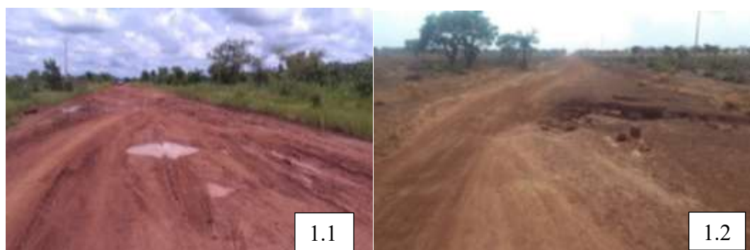
Planche 1 : Etat degrade des voies à Materi et à Boukoumbe

En effet, les Communes d'étude sont bien desservies par un reseau important de pistes de desserte rurale. Ces pistes couvrent tout le territoire de ces Communes permettant ainsi la jonction entre les chefs-lieux d'arrondissement et les villages. Elles jouent un rôle important dans le transport des produits agricoles. Mais c'est environ 20 % de ces pistes qui connaissent un trace reel et sur lesquelles environ 75 % d'ouvrages d'art (ponts, ponceaux et ponts submersibles) sont realises. Par consequent, les acteurs des echanges transfrontaliers sont confrontes aux problèmes du mauvais etat des pistes rurales et voies qui ne leur facilitent pas l'accès aux differents marches. Ce problème s'intensifie surtout pendant la saison pluvieuse. La planche 1 montre quelques cas de degradation des pistes et voies dans le milieu d'étude.