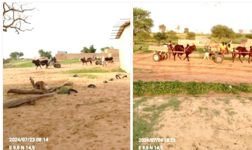
a/départ des femmes vers les champs

La migration des hommes entraîne une participation accrue des femmes aux activités agricoles où elles font office de main-d'œuvre. La production agricole dans le Koutous repose en général sur le travail féminin. Les femmes passent de la culture du gombo dans les petites vallées sèches à la pleine implication dans l'agriculture. De nos jours, elles assurent toutes les tâches agricoles du semis à la récolte. Chaque matin, ces femmes accompagnées de leurs enfants quittent les villages pour se rendre aux champs souvent éloignés et ne reviennent qu'au coucher du soleil. Cela est plus visible durant les travaux intenses du sarclage où partout se remarquent des flux de charrettes partant ou revenant des champs (page 1).