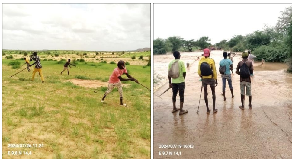
a. ouvriers actifs au champ

La main-d'œuvre agricole payante est constituée de travailleurs locaux et étrangers. Selon un ancien migrant du village de Karbo, « les femmes s'adonnent au salariat agricole. Elles sont payées chacune en raison de 1 000 à 1 500 francs CFA par journée de travail. » Cela prouve que la femme assure la main-d'œuvre agricole dans la zone au-delà de la sphère familiale. Toutefois, l'essentiel de la main-d'œuvre payante employée est étrangère. Selon le maire de la commune de Gamou, « pour combler le vide créé par l'absence des hommes, les agriculteurs comptent sur les jeunes qui viennent des départements de Kantché et Magaria pour vendre leur force de travail. » D'après le chef du village de Daoutcha, « depuis 2000, ces jeunes travailleurs font la fierté de la zone puisqu'ils apportent beaucoup d'assistance dans nos travaux champêtres. » Pour cela, chaque année les flux de ces travailleurs ne cessent d'augmenter de par leur contribution significative à la production agricole dans le Koutous (page 2).