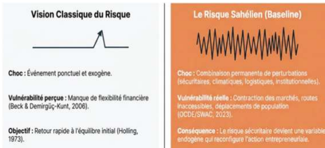
Figure 1. De l'anomalie au risque endogène : le creuset sahélien.

La vulnérabilité des PME sahéliennes ne relève pas de leur seule taille, mais d'une stigmatisation territoriale où l'incertitude devient structurelle et où la gestion du risque se transforme en compétence de survie quotidienne (Forogo, 2026).